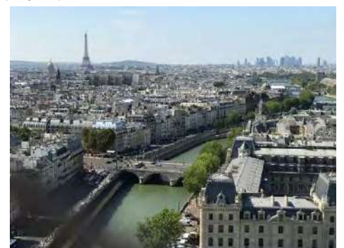
セーヌ河とエッフェル塔

より詳しいことは4月からのフランス語の教室にて—— ア・ピヤント！じゃあ、また！