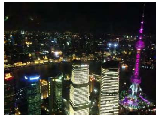
黄浦江と東方明珠塔

http://www.shnu.edu.cn/ / http://iccs.shnu.edu.cn/