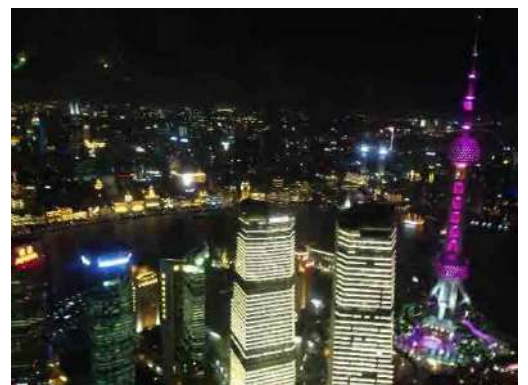
黄浦江と東方明珠塔