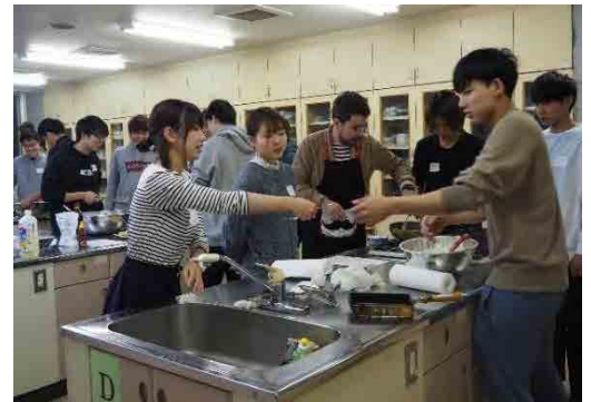
フランス人の先生とクレープ作りに挑戦!

「フランス語は何となく難しそう…」と思っているあなた! そんなことはありません! フランス語には英語と形がよく似た単語がたくさんあります(英単語の約半分はフランス語起源なので)。例えば「テーブル」は、フランス語でも Table と綴ります。英語と同じですね。あとは、フランス語の発音と綴り字の規則を覚えれば大丈夫。フランス語の発音規則は英語よりもずっと例外が少ないので、一年のうちにマスターしてしましましょう(ちなみに Table はフランス語だと「ターブル」とローマ字風に発音)。フランス人の先生のチャット・ルーム(授業ではないので自由参加)では、先生が企画される様々なイベントを通じて、ネイティブのフランス語に触れることもできます。日本語も上手な先生なので、挨拶、自己紹介、自分の好き嫌い、趣味…と、授業を思い出しながら会話練習しましょう。フランス人はおしゃべりで自分の意見を述べるのが大好きです。フランス人になって、間違いを恐れず大きな声で会話しましょう! 授業では、発音と文法を中心にフランス語の基礎を勉強しながら、基本的なフランス語を読んだり、聞いたりして理解力を高めます。1年の終わりには実用フランス語検定試験5級に合格できるくらいの実力が身についているはず。やる気のある人は、11月にチャレンジしてみましょう! また授業では、フランスの地理、文化、歴史について、ビデオを見ながら広く学ぶ時間を取っています。フランスのワインの産地、パリの街角のカフェ、ファッションブランド街、ゴッホやセザンヌやモネの描いた風景、ルーブル美術館や凱旋門やヴェルサイユ宮殿の歴史、ノートルダム大聖堂やシャルトル大聖堂などの建築様式などなど。これであなたもフランス通に!