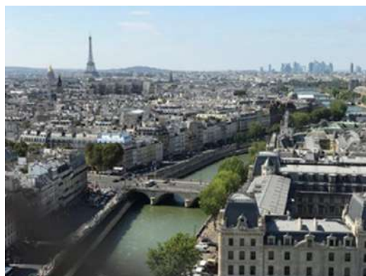
セーヌ河とエッフェル塔