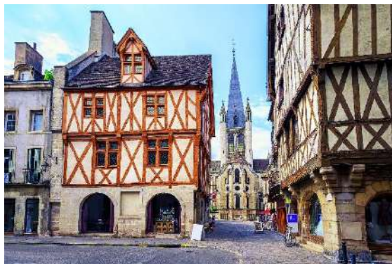
ディジョンの旧市街

大学ではフランス語を勉強して、卒業旅行には、芸術、文化、美食、ファッションの国フランスへ行ってみましょう！その時には、授業で覚えたフランス語を使って、「アン・カフェ・シルヴブレ」（コーヒーを一杯ください）、「ウエラ・スタッション・ドゥ・メトロ？」（地下鉄の駅はどこ？）というように、フランス人とのコミュニケーションを楽しみましょう。