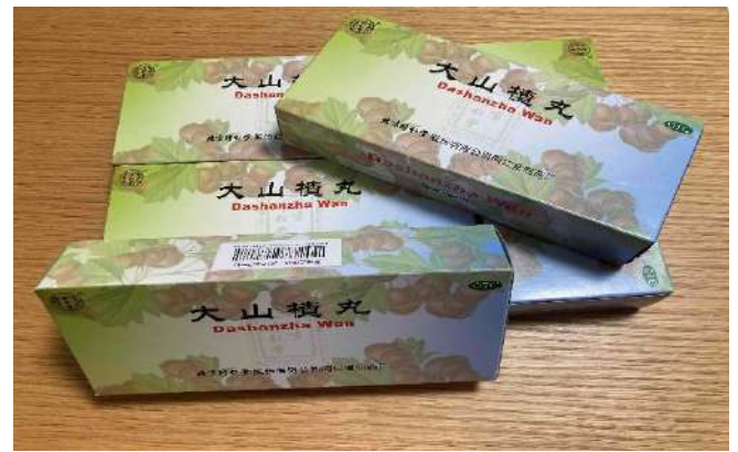
中国で販売されている漢方薬

みなさんは授業で中国独自の略式漢字（簡体字）とローマ字による発音記号（ピンイン）を学びます。「簡体字!?ピンイン!?何それ!?!」と思ったかもしれませんが、心配することはありません。みなさんは普段から漢字を使っているのですぐに簡体字に慣れるでしょう。ピンインについても、新しい文字を学ぶわけではないので、何度も読めば慣れてきます。