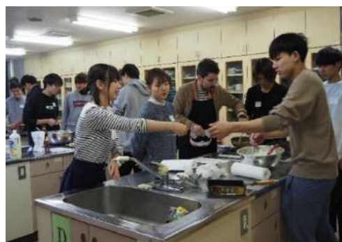
フランス人の先生とクレープ作りに挑戦！

基本的なフランス語会話を声に出して読んだり、聞いたりします。ペアになって、相手に質問したり、自分のことを答えたりと、先輩達もフランス語会話の練習を楽しんでいます！1年の終わりには実用フランス語検定試験5級に合格できるくらいの実力が身についているはず。やる気のある人は、11月にチャレンジしてみましょう！