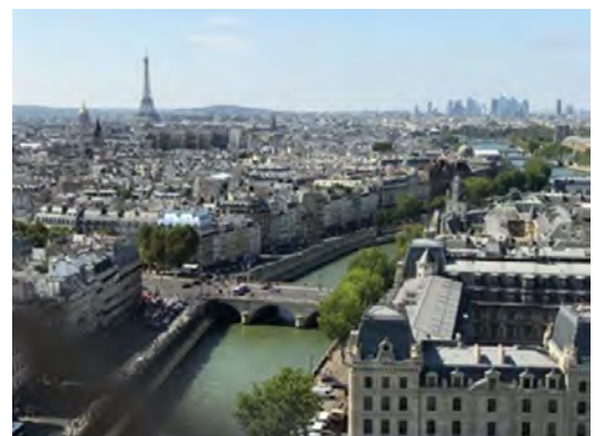
セーヌ河とエッフェル塔