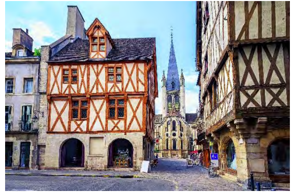
ディジョンの旧市街

大学ではフランス語を勉強して、卒業旅行には、芸術、文化、美食、ファッションの国フランスへ行ってみましょう！その時には、授業で覚えたフランス語を使って、「アン・カフェ・シルヴブレ」（コーヒーを一杯ください）、「ウエラ・スタッション・ドゥ・メトロ？」（地下鉄の駅はどこ？）というように、フランス人とのコミュニケーションを楽しみましょう。