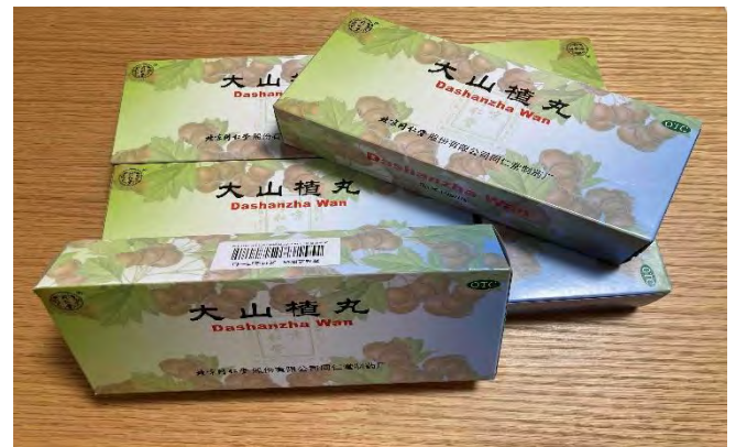
中国で販売されている漢方

みなさんは授業で中国独自の略式漢字(簡体字)とローマ字による発音記号(ピンイン)を学びます。「簡体字！？ピンイン！？何それ！？」と思ったかもしれませんが、心配することはありません。みなさんは普段から漢字を使っているのですぐに簡体字に慣れるでしょう。ピンインについても、新しい文字を学ぶわけではないので、何度も読めば慣れてきます。