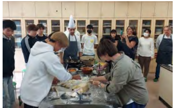
フランスからシェフを招いての料理講座

「フランス語は何となく難しそう…」と思っているあなた！そんなことはありません！フランス語には英語と形がよく似た単語がたくさんあります（英単語の約半分はフランス語起源なので）。例えば「テーブル」は、フランス語でも Table と綴ります。英語と同じですね。あとは、フランス語の発音と綴り字の規則を覚えれば大丈夫。フランス語の発音規則は英語よりもずっと例外が少ないので、一年のうちにマスターしてしましましょう（ちなみに Table はフランス語だと「ターブル」とローマ字風に発音）。フランス人の先生のチャット・ルーム（授業ではないので自由参加）では、先生が企画される様々なイベントを通じて、ネイティブのフランス語に触れることもできます。日本語も上手な先生なので、挨拶、自己紹介、自分の好き嫌い、趣味…と、授業を思い出しながら会話練習しましょう。フランス人はおしゃべりで自分の意見を述べるのが大好きです。フランス人にならって、間違いを恐れず大きな声で会話しましょう！授業では、発音と文法を中心にフランス語の基礎を勉強しながら、基本的なフランス語を読んだり、聞いたりして理解力を高めます。1年の終わりには実用フランス語検定試験 5 級に合格できるくらいの実力が身についているはず。やる気のある人は、11 月にチャレンジしてみましょう！また授業では、フランスの地理、文化、歴史について、ビデオを見ながら広く学ぶ時間を取っています。フランスのワインの産地、パリの街角のカフェ、ファッションブランド街、ゴッホやセザンヌやモネの描いた風景、ルーブル美術館や凱旋門やヴェルサイユ宮殿の歴史、ノートルダム大聖堂やシャルトル大聖堂などの建築様式などなど。これであなたもフランス通に！