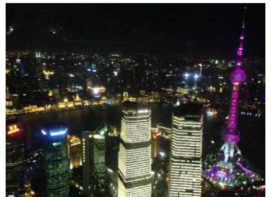
黄浦江と東方明珠塔