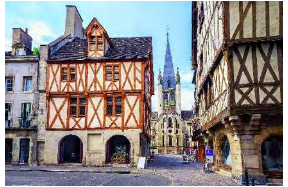
ディジョンの旧市街

大学ではフランス語を勉強して、芸術、文化、美食、ファッションの国フランスへ行ってみよう！その時には、授業で覚えたフランス語を使って、「アン・カフェ・シルヴブレ」（コーヒーを一杯ください）、「ウエラ・スタッション・ドウ・メトロ？」（地下鉄の駅はどこ？）というように、フランス人とのコミュニケーションを楽しみましょう。